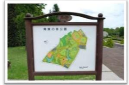
次回は青葉の森公園です！